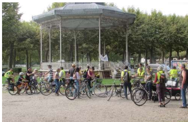
Vélorution du samedi 25 septembre à Agen

En parallèle, Action Non-Violente COP21 Lot-et-Garonne (que nous avons mentionné dans notre dernier Maillon ) constitue la branche « résistance » du mouvement Alternatiba en recourant à des actions non-violentes de désobéissance civile. Chacun.e peut trouver sa place dans ces deux mouvements qui bien que complémentaires, restent distincts et toutes les compétences et les envies sont les bienvenues !