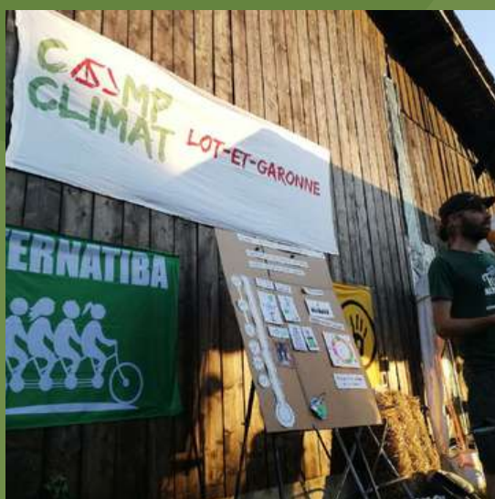
Camps Climat 2021 : https://campclimat.eu

Focus action : En partenariat avec Action Non-Violente Cop21 Lot-et-Garonne et Citoyens Pour le Climat Agen, Alternatiba Lot-et-Garonne a organisé un Camp Climat à Bourran sur deux jours cet été. Une quinzaine d'activités ont été proposées aux participants avec de nombreuses thématiques. Les formations ont montré comment appréhender les relations avec les forces de l'ordre, animer un collectif et des réunions, militer par la construction d'alternatives, communiquer de manière non-violente, etc. Les jours passés au Camp Climat ont également favorisé l'échange de connaissances entre anciens et nouveaux militants qui ont partagé leurs expériences et se sont préparés ensemble, dans la convivialité et la détermination, aux mobilisations à venir.